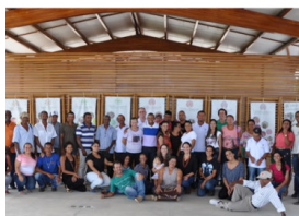
Realizado encontro de coletores de sementes florestais em Teixeira de Freitas