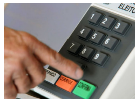
Eleições 2016: PRE/BA recomenda a órgãos e entidades públicos baianos que fiscalizem afastamento de servidores candidatos