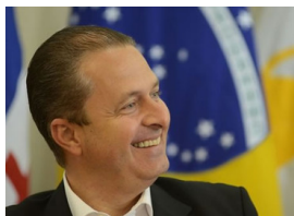
FAB divulga vídeo inédito com imagens de acidente que matou Eduardo Campos